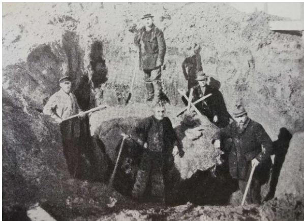
Abb. 1 In Handarbeit ausgegraben 1