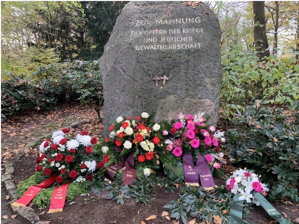
Der Gedenkstein heute

Die deutsche Traditionsblume, die Vergissmeinnicht, kam erst nach dem Zweiten Weltkrieg auf. Vorher gab es keine einheitliche Erinnerungskultur und -symbolik (s. o.). Erst ab den Fünfzigerjahren entwickelte sich ein Konsens über die Trauer der Kriegstoten. Als Symbol bot sich die kleine, aber dennoch robuste Pflanze die Vergissmeinnicht an. Das Vergissmeinnicht entstammt der Romantik des 19. Jahrhunderts und gilt Sinnbild der Liebe. Vielfach wurden den Soldaten von ihren Frauen, Verlobten und Freundinnen getrocknete Vergissmeinnichtblüten mitgegeben. Häufig schmückten Ansichtskarten kleine Vergissmeinnichtbuketts. Einen direkten, dem Ersten Weltkrieg zuordenbaren Aspekt gab es nicht.