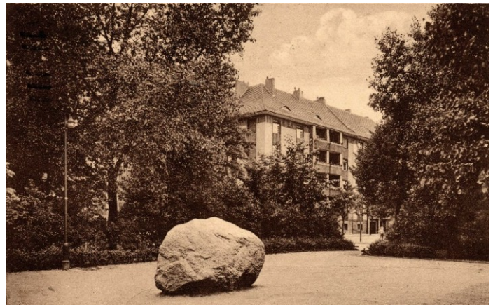
Abb. 2 Hintergrund die Wohnhäuser 2

An dem Ort verblieb er bis 1934. In diesem Jahre wurde die NSKOV Britz (NS-Kriegsopferfürsorge) auf diesen Stein aufmerksam. Sie entwarf den Plan einer Gedenkstätte, als „Ehrenhain“ titulierte, in Britz zu errichten. Der „Neuköllner Heimatbote“ (nicht zu verwechseln mit dem „Neuköllner Heimatverein“ oder dem „Britzer Heimatboten“!) berichtet in typischen Duktus der Nazi-Propaganda, das „... der Wanderer, der hier vorbeikommt [Standort Akazienwäldchen] wird in Ehrfurcht aufschauen zu der Stätte, die den gefallenen Helden geweiht ist.“