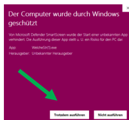
Abb. 4: „Trotzdem ausführen“

Klicken Sie auf den Link „Weitere Informationen“. Anschließend klicken Sie im neuen Fenster „Trotzdem ausführen“ (s. Abb. 4).