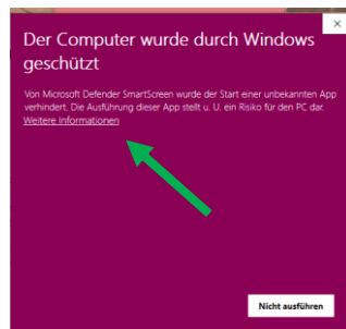
Abb.: 3 Sicherheitsabfrage

Klicken Sie auf den Dateinamen, den Sie zuletzt heruntergeladen haben (Abb.: 3).